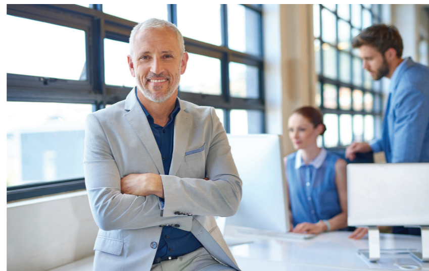
ZEEL Personalberatung: Z steht für Zeit, E für Elan, E für Energie und L für Leistung

ipu fit for success hat uns sehr professionell bei der Klärung und sinnvollen Abgrenzung unserer Kernprozesse unterstützt. Von der Fachkompetenz und langjährigen Erfahrung der Berater im Aufbau von QM-Systemen haben wir ganz besonders profitiert – ganz einfach, weil wir hier am wenigsten eigene Kenntnisse hatten. Also der Aufbau eines Handbuchs, der Dokumentenlenkung, wie man Messmethoden entwickelt und vieles mehr. Zeel war auch eines der ersten Unternehmen mit der Zertifizierung nach der neuen ISO-Norm 2015, wo es darauf ankommt, die Unternehmensleitung stärker in die QM-Themen zu involvieren, Risiken zu erkennen und das ganze Unternehmen auf ständige Verbesserung auszurichten. ipu hat uns sicher durch die gesamte Vorbereitung geführt und wir haben die Zertifizierung durch die DEKRA problemlos bestanden – daher eine klare Empfehlung! •